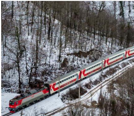
Организованная группа - группа из 10 и более пассажиров, следующих в поезде по одному маршруту, оформленная по одной заявке

Перспективы на 2023 г. Расширение полигона до 50 наиболее востребованных маршрутов Внедрение специального тарифа на туристических поездах Тип вагона - купе